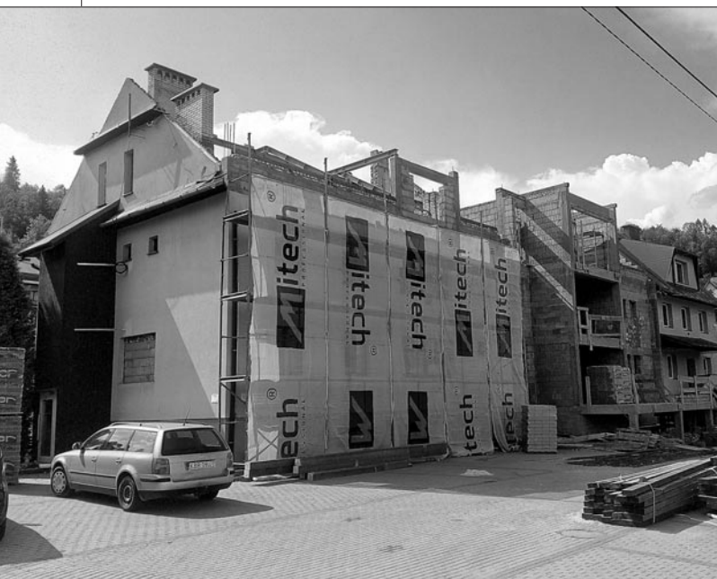
Budowa ośrodka zdrowia i Środowiskowego Domu Samopomocy w Mszanie Górnej