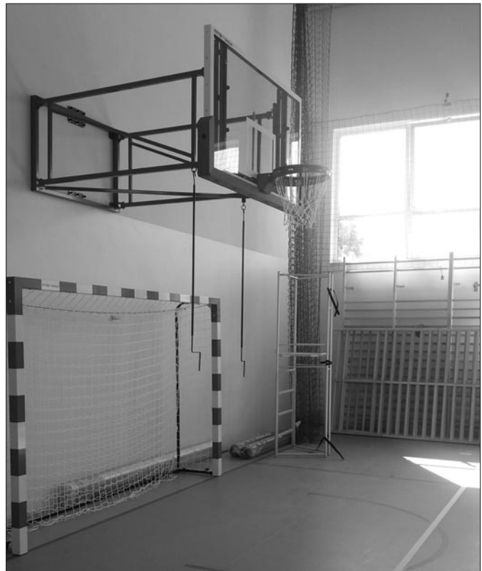
Sala gimnastyczna przy szkole nr 2 w Mszanie Górnej

piękną, wyposażoną już w biurka komputerowe salę informacyjną dla potrzeb młodzieży szkolnej.