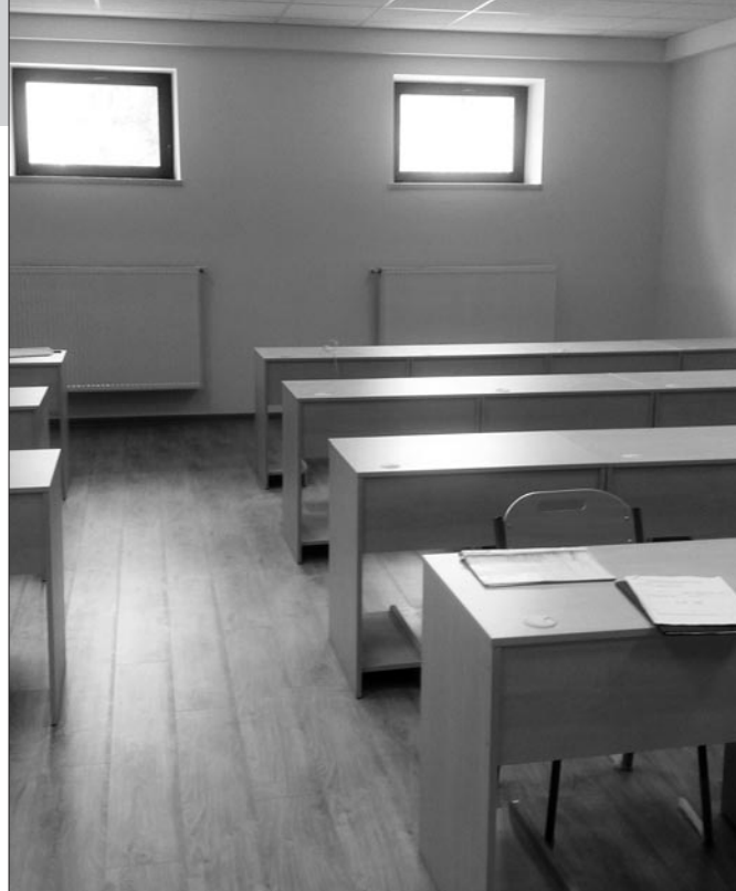
Sala komputerowa w szkole w Łętowem