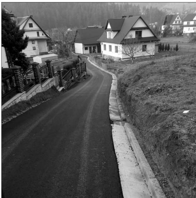
Droga do Os. Płoskonki w Kasince Matej