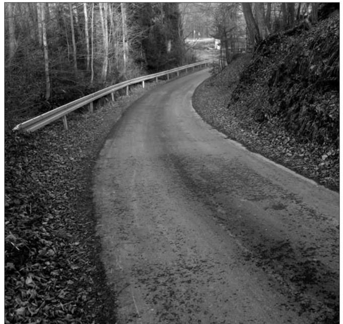
Droga do Os. Kalety w Kasince Małej

Remont drogi na os. Gryzy-Kunochy w miejscowości Olszówka