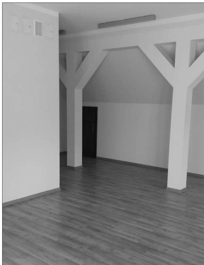
Nowe klasy w SP w Łostówce

REFERAT INWESTYCJI I ZAMÓWIENI PUBLICZNYCH UG MSZANA DOLNA