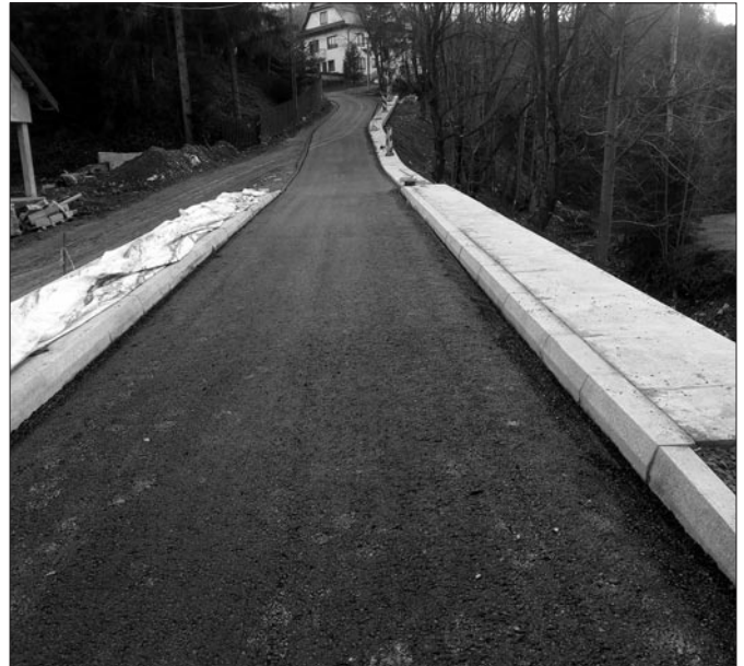
Odbudowana droga w Lubomierzu na Os. Borki