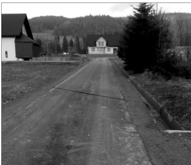
Droga do Os. Toboty w Łostówce

ków UE dotacja w kwocie 1 840 743 zł (PROW). Ze środków Wojewódzkiego Funduszu Ochrony Środowiska i Gospodarki Wodnej w Krakowie 4 119 658,00 zł (preferencyjna pożyczka z możliwością częściowego umorzenia). Ze środków Gminy Mszana Dolna: 2 097 316 zł.