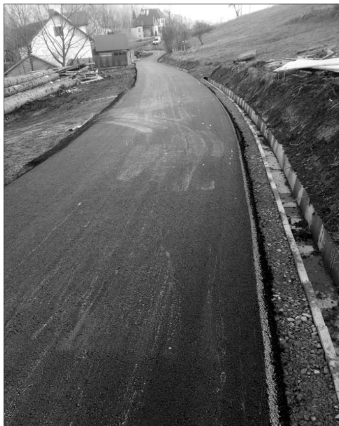
Droga do Os. Uchryny w Glisnem