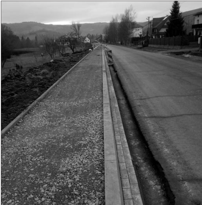
Budowa chodnika przy drodze powiatowej w Łętowie